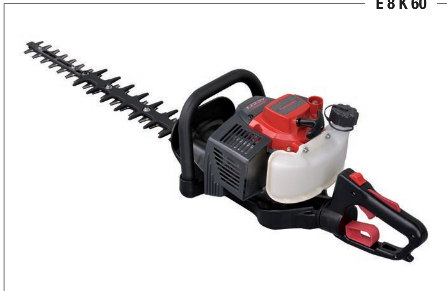
E 8 K 60