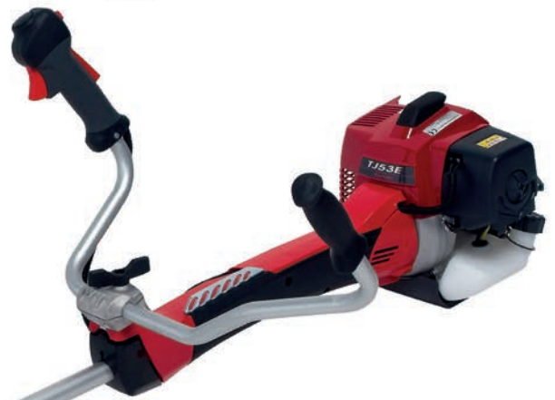
TJ 53 TOP

Decespugliatore Professionale - Impugnatura a manubrio Carter copriasta integrato con il motore Motore Kawasaki TJ-53 - 53,2 cc - Potenza 2,0 kW - 7500 RPM Avviamento facilitato con sistema KAR - Serbatoio 1,1 litri Asta 28 mm e Coppia Conica Made in Italy Testina filo nylon 10x1,00 SX Peso 8,4 kg