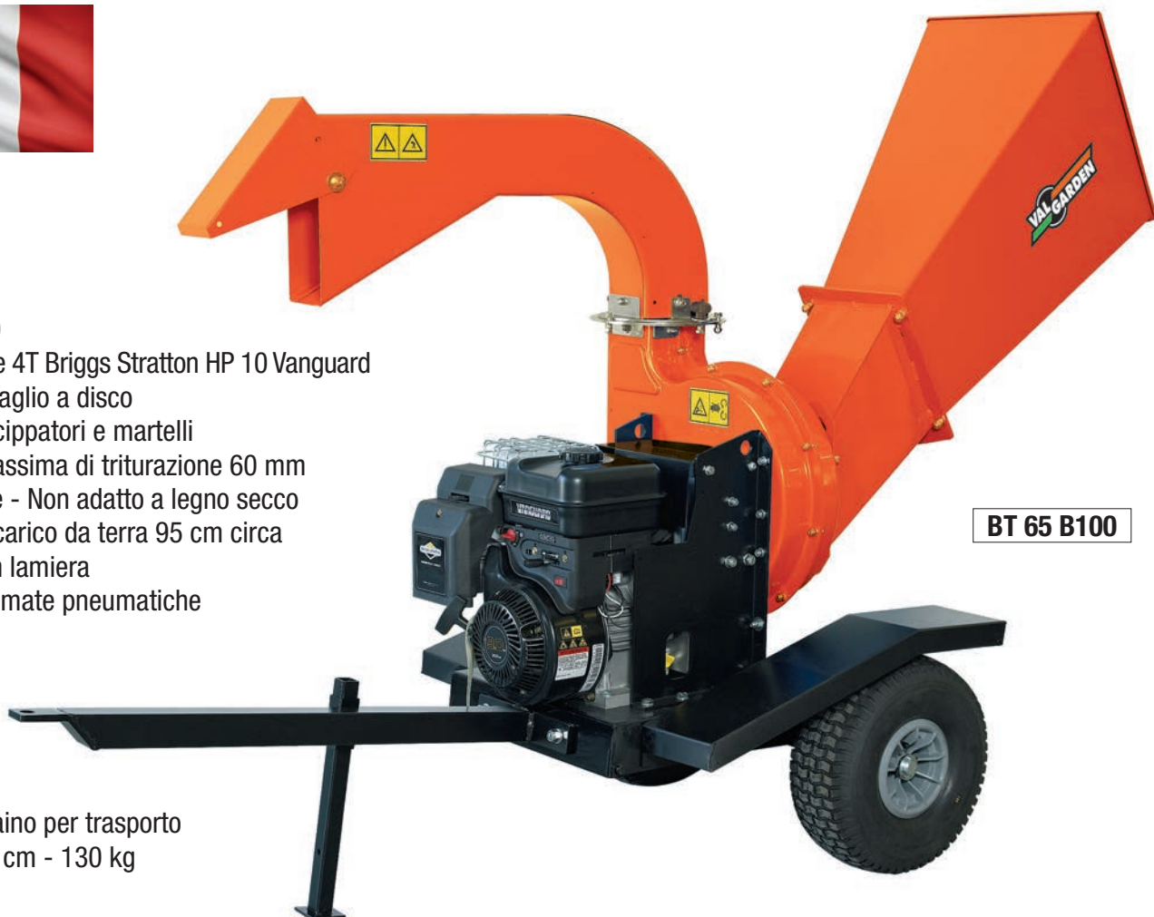
BT 65 B100

Biotrituratore 4T Briggs Stratton HP 10 Vanguard Sistema di taglio a disco con coltelli cippatori e martelli Capacità massima di triturazione 60 mm Legno verde - Non adatto a legno secco Altezza di scarico da terra 95 cm circa Cavalletto in lamiera e ruote gommate pneumatiche