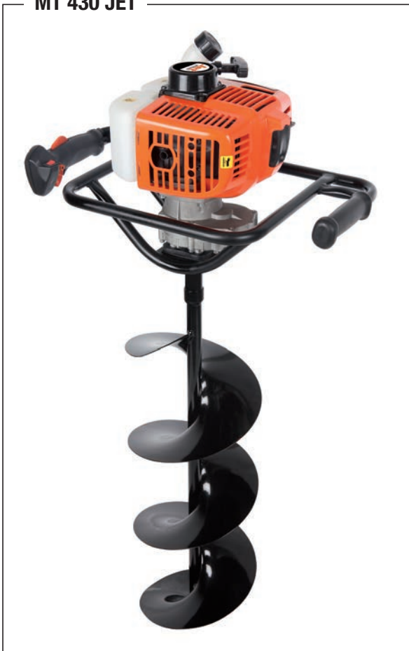
MT 430 JET