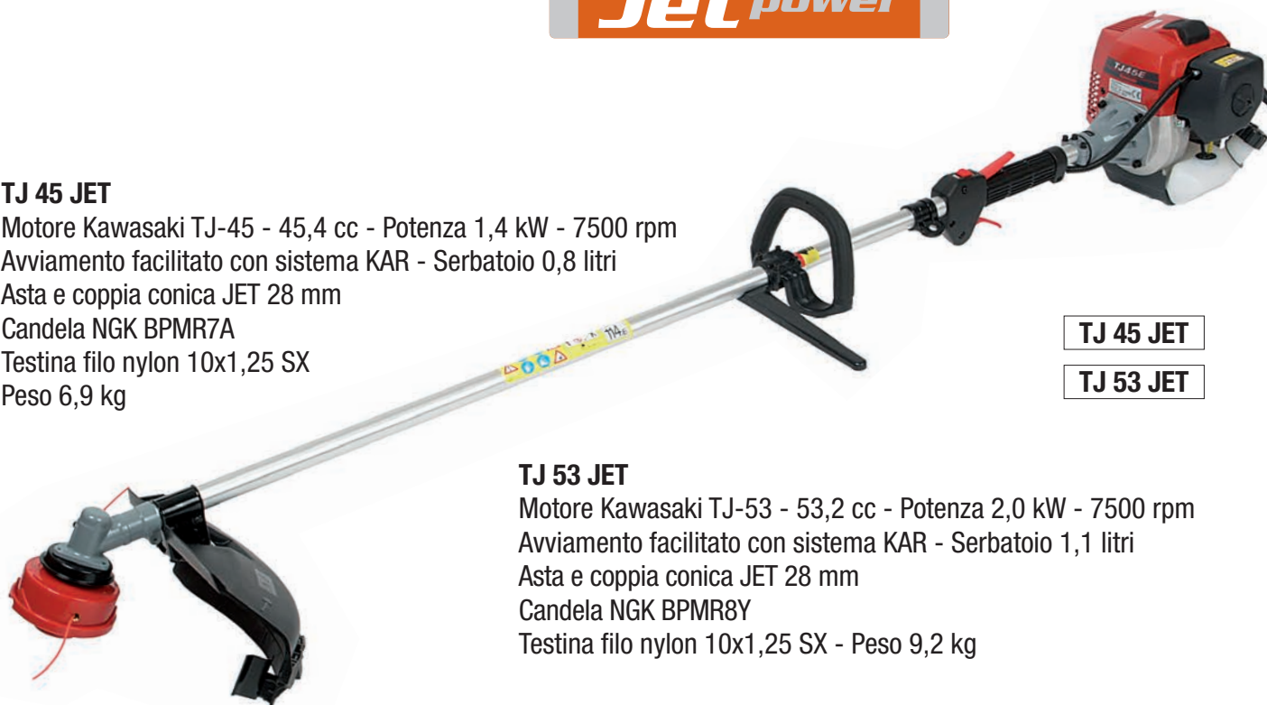
TJ 45 JET

Motore Kawasaki TJ-45 - 45,4 cc - Potenza 1,4 kW - 7500 rpm Avviamento facilitato con sistema KAR - Serbatoio 0,8 litri Asta e coppia conica JET 28 mm Candela NGK BPMR7A Testina filo nylon 10x1,25 SX Peso 6,9 kg