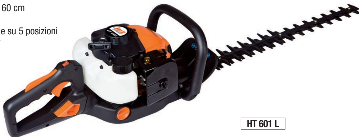
HT 601 L

Coppia Lama JTR Y.02020070063 Avviamento Completo JTR Y.02050070047