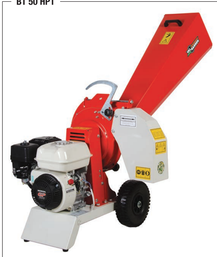
BT 50 HP1

stesso modello con motore 4T Honda GP-160