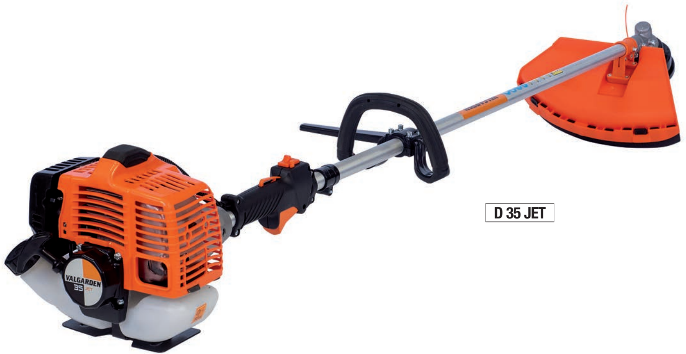
D 35 JET