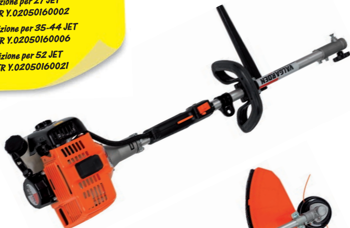
DK 30 DC

Collettore per 27 JET JTR Y.02110030031 Collettore per 35 JET JTR Y.02110030036 Collettore per 44-52 JET JTR Y.70030020014