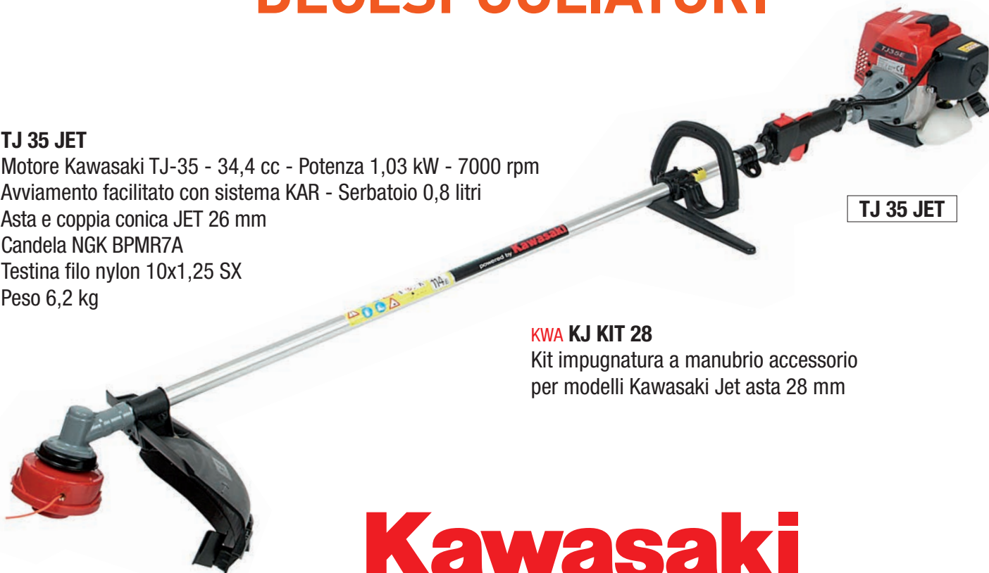
TJ 35 JET

Motore Kawasaki TJ-35 - 34,4 cc - Potenza 1,03 kW - 7000 rpm Avviamento facilitato con sistema KAR - Serbatoio 0,8 litri Asta e coppia conica JET 26 mm Candela NGK BPMR7A Testina filo nylon 10x1,25 SX Peso 6,2 kg